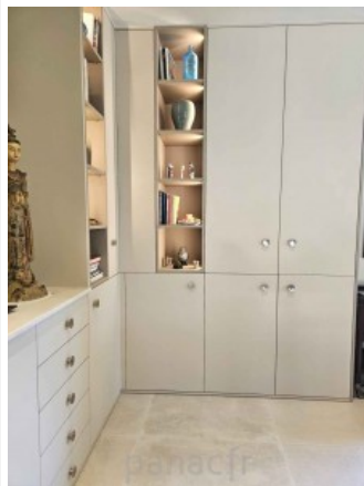
Bibliothèque sur mesure