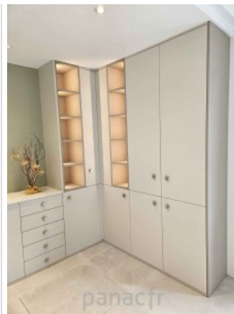
Bibliothèque sur mesure