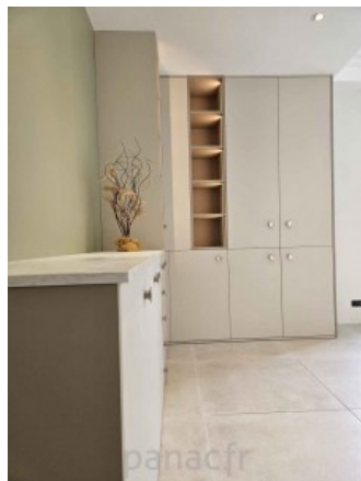
Bibliothèque sur mesure