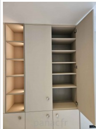
Bibliothèque sur mesure