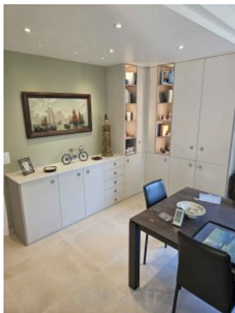
Bibliothèque sur mesure