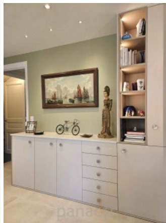
Bibliothèque sur mesure