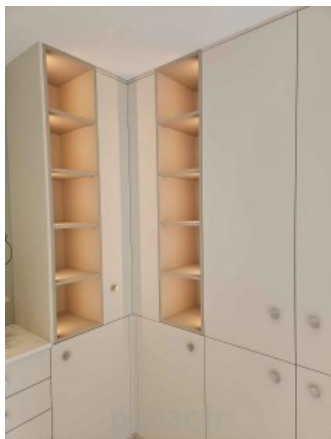
Bibliothèque sur mesure