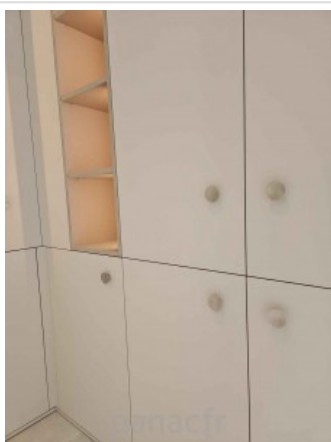
Bibliothèque sur mesure