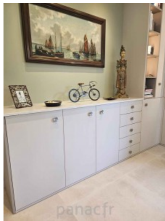
Bibliothèque sur mesure