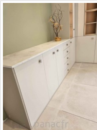
Bibliothèque sur mesure