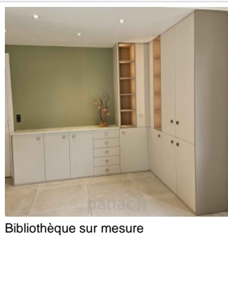
Bibliothèque sur mesure