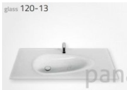
Les dimensions possibles du sur-mesure