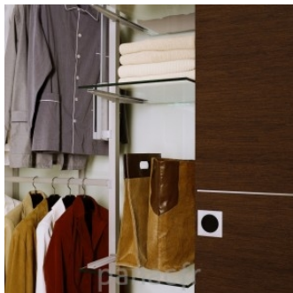
Personnalisez et optimisez votre dressing