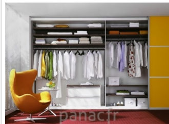
Personnalisez et optimisez votre dressing