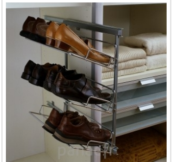
Personnalisez et optimisez votre dressing