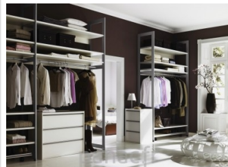
Personnalisez et optimisez votre dressing