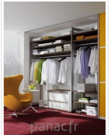
Personnalisez et optimisez votre dressing