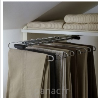
Personnalisez et optimisez votre dressing