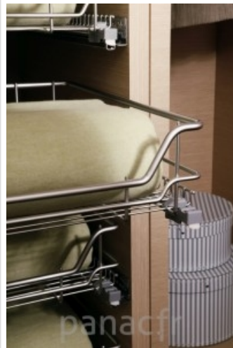
Personnalisez et optimisez votre dressing