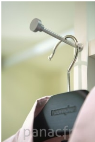
Personnalisez et optimisez votre dressing