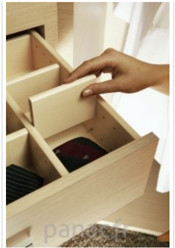
Personnalisez et optimisez votre dressing