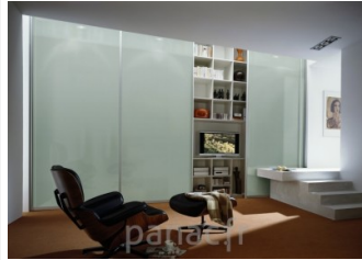
Rénovation, aménagement et décoration de votre intérieur