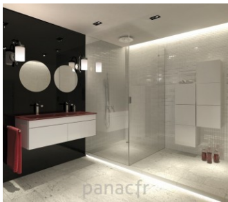
Rénovation, aménagement et décoration de votre intérieur