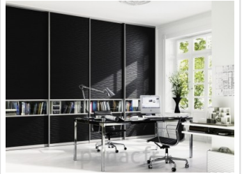
Rénovation, aménagement et décoration de votre intérieur