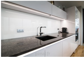
noble- mperial grey - realisation 1