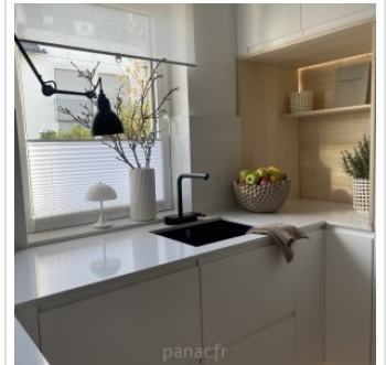
noble supreme white - realisation 1