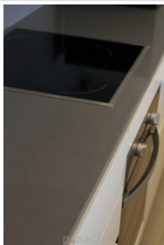
gobi grey realisation 2