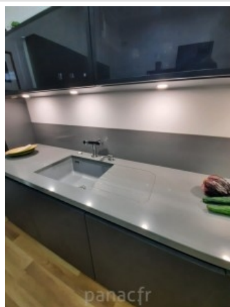
gobi grey realisation 1