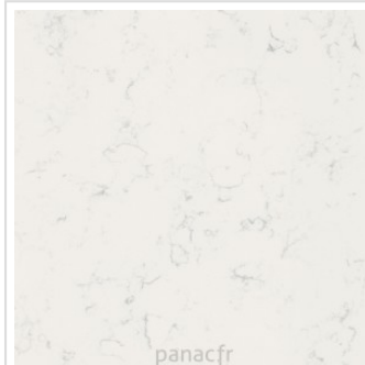
noble areti bianco détail