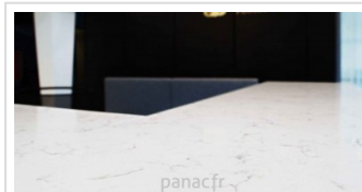
noble carrara realisation 2