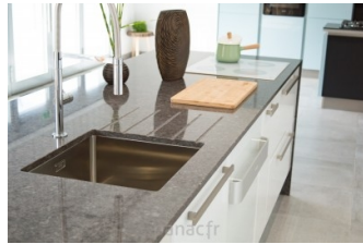
noble imperial grey - realisation 2