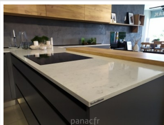
noble areti bianco - realisation 1