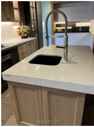
noble areti bianco - realisation 2