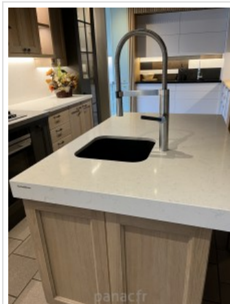
noble areti bianco - realisation 2