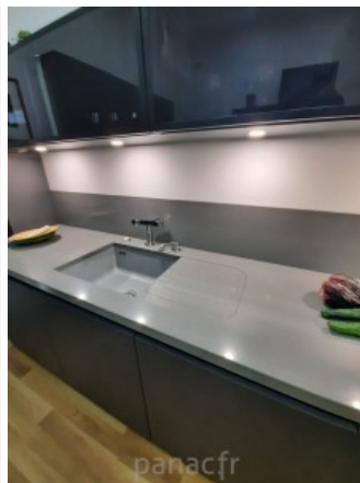
gobi grey realisation 1